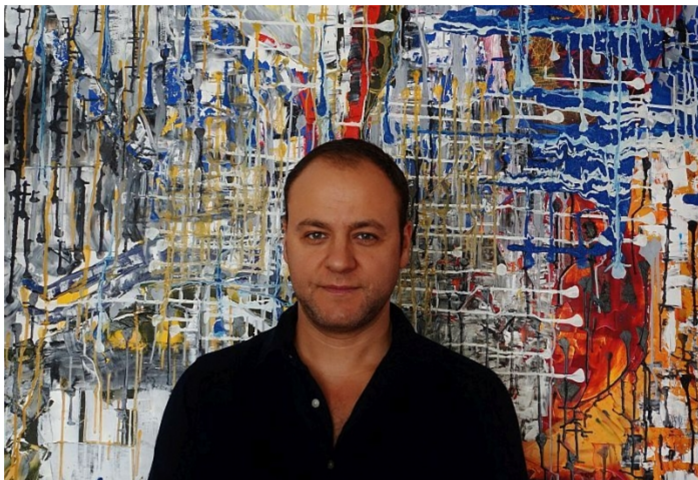
Фото из архива героя

Автор: Заррина Салимова, Люцерн, 4. 10. 2017 Просмотров:4004