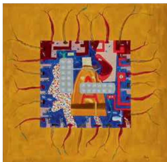
Медицина из цикла «Человеческие слабости». Эта картина была написана под музыку, которую я сам сочинил несколько лет назад на эту тему.

Конечно, нет. Здесь нет никакой стратегии. Я выставляюсь там, куда меня приглашают, и делаю это с огромным удовольствием. Естественно моё желание – это привлечь как можно больше публики к искусству. Бездумное созерцание картин или безразличное восприятие музыки не имеет никакого смысла, потому я хочу, чтобы тема искусства была актуальна во все времена. И в этом мне поможет КОДУИЗМ.