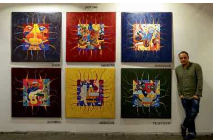
Цикл «Человеческие слабости». Фотография была сделана на выставочной ярмарке в Гонконге.

В истории мы наблюдаем большое количество композиторов, которые под впечатлением различных произведений искусства писали музыку. Например, Рахманинов сочинил симфоническую поэму «Остров мёртвых» под впечатлением картины швейцарского художника Арнольда Бёклина. Или фортепианная пьеса Клода Дебюсси «Остров радости», которая была также написана под впечатлением от картины Антуана Ватто «Паломничество на остров Киферу».