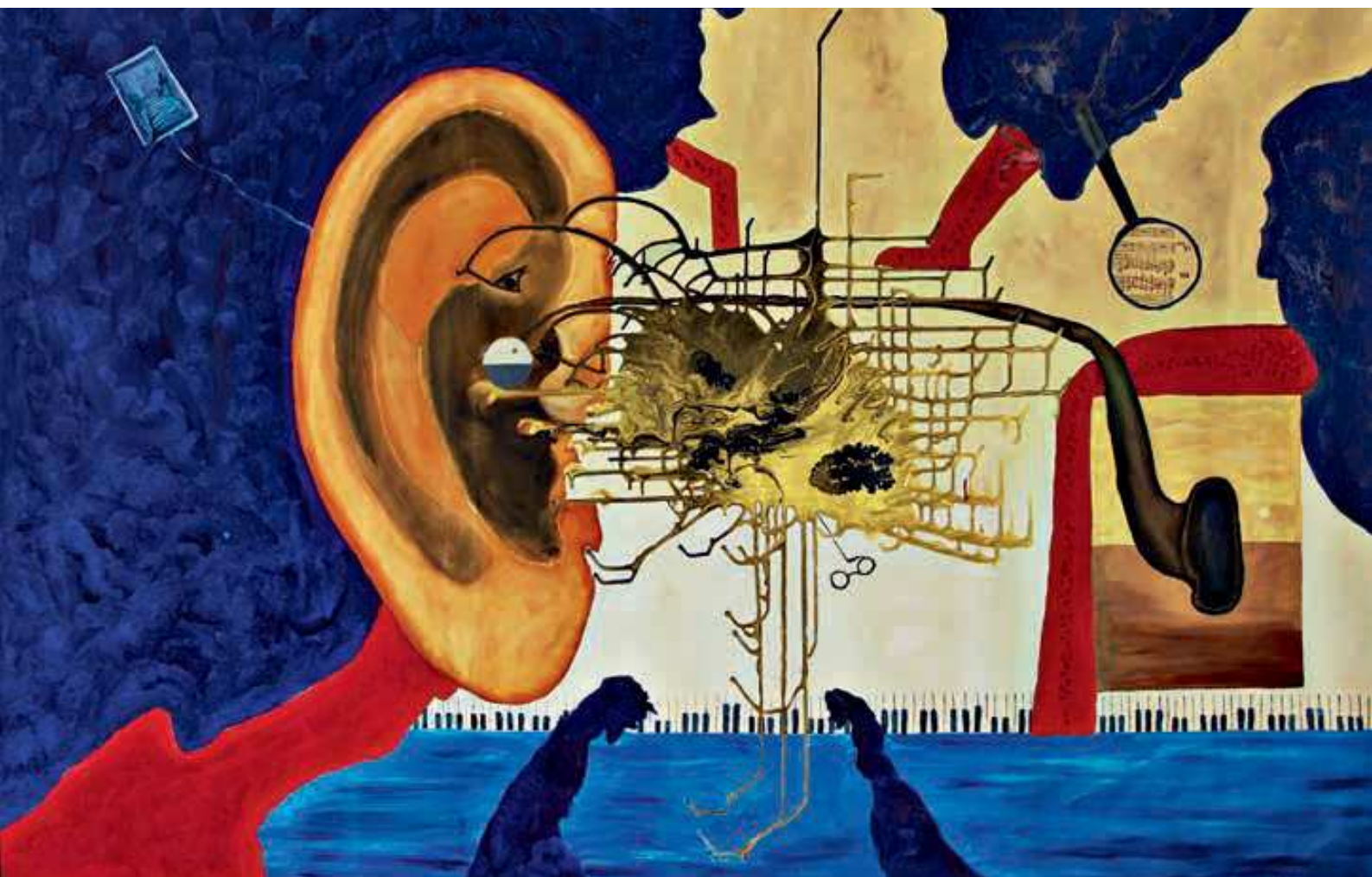
Людвигу ван Бетховену по случаю его 250-летия я посвящаю эту кодуистическую картину.