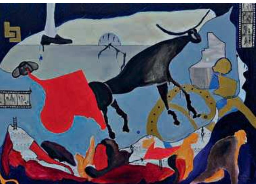
«Песня Торeadора». Эта кодуистическая картина была написана для всемирно известной арии из оперы «Кармен» Ж. Бизе.

Немецкая художница COCOW и я основали кодуизм (Coduism) новое направление в современном искусстве, изображающее особые реальности, созданные человеком. Мы рисуем музыку.