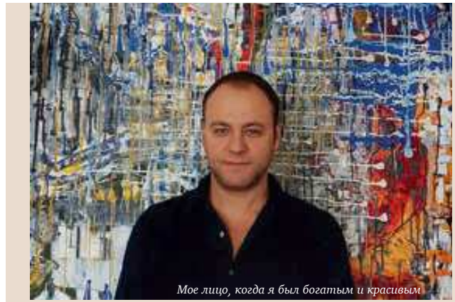
Мое лицо, когда я был богатым и красивым

Искусство сопровождает человека на протяжении всего его существования. Всё началось с первобытных людей, которые творили примитивные рисунки на стенах пещер. В наше время существуют различные направления искусства. Музыка, живопись, литература и т.п., где человек стремится придумать что-то новое, особенное, и этим внести свой вклад в развитие человечества. Искусство позволяет возродить события из про-